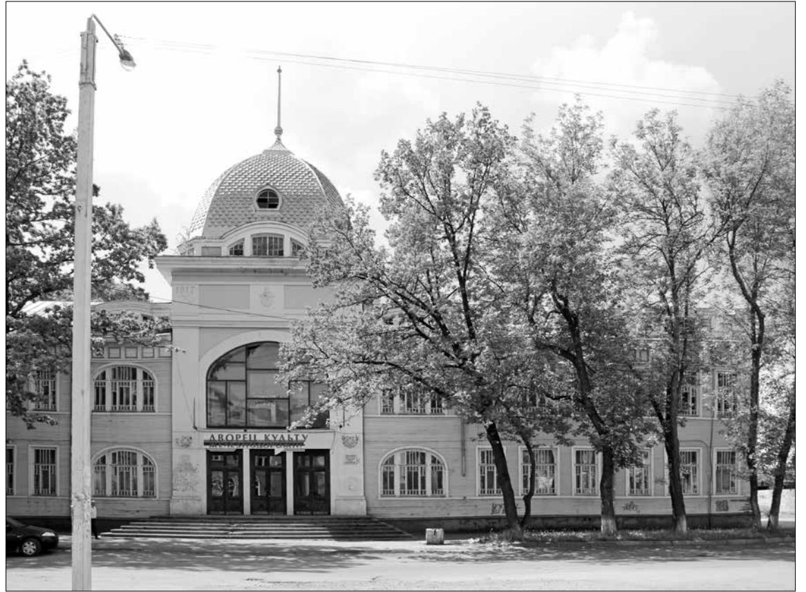
Дом культуры железнодорожников на улице Ветошкина, 12.

Интересна и территория вокруг здания. До того, как был построен Дворец культуры железнодорожников, на этом месте располагался Самаринский сад, называемый так по имени известного домовладельца, либерала и благотворителя. На территории сада, в большом деревянном здании, в конце XIX века находился исправительный приют для мало-