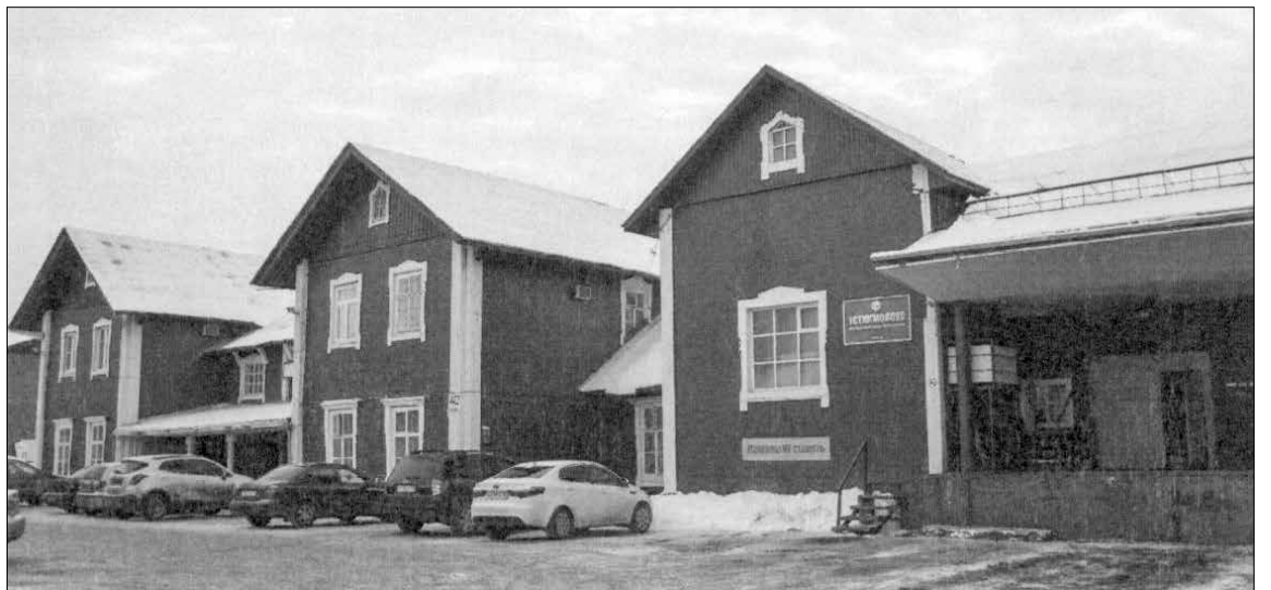
...и оно же в 2015 году. Современный адрес — улица Чехова, 40.