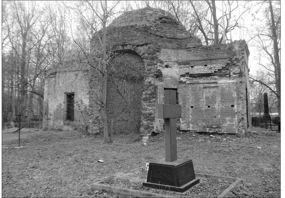
Комплекс Введенского кладбища.

Сейчас казармы переданы в муниципальную собственность. К сожалению, сегодня ансамбль находится в аварийном состоянии, часть помещений пострадала от пожара.